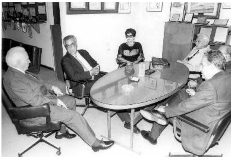
Reunião de trabalho na sede da STEA com a presença do deputado federal Miro Teixeira. – Rio de Janeiro, 1995 (RN.F.0021).