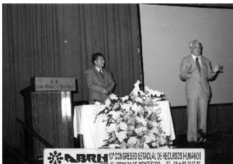
RN no 13º Congresso Estadual de Recursos Humanos da Associação Brasileira de Recursos Humanos, realizado no Clube Ginástico Português. – Rio de Janeiro, 1997 (RN.F.0022).