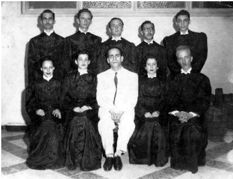
Formatura de RN como Bacharel em Matemática na Faculdade Nacional de Filosofia da Universidade do Brasil. Dezembro de 1942 (RN.F.0001).