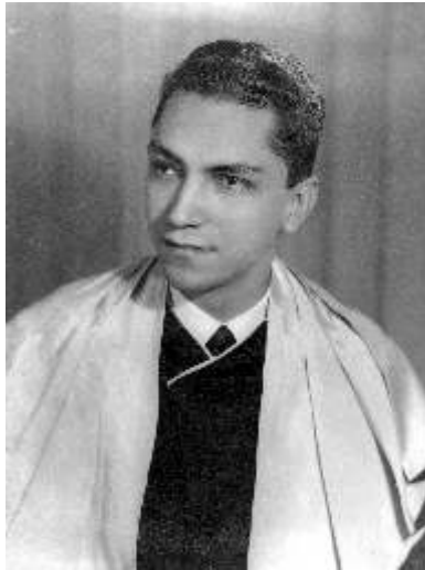
Retrato de formatura de RN (RN.F.0028).