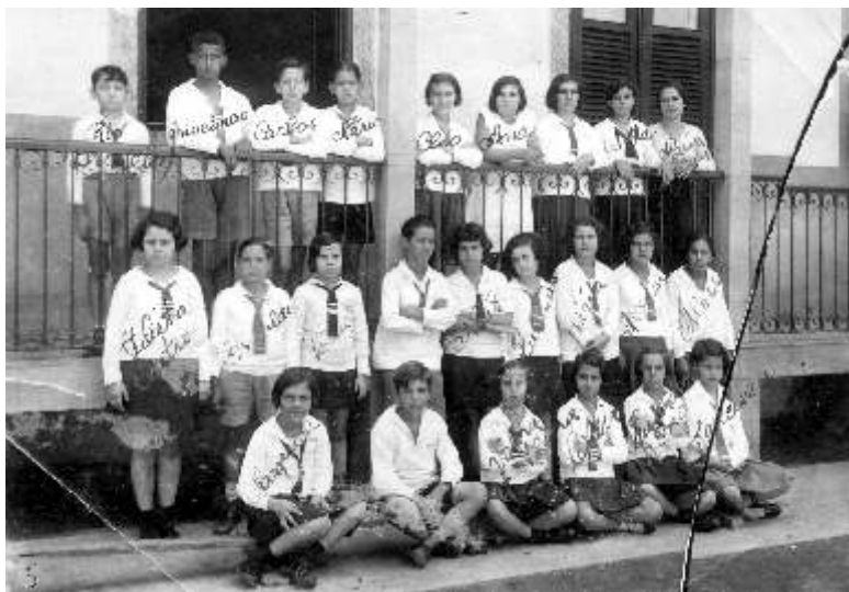
RN com o grupo de estudantes provavelmente do ensino primário da Escola Pública Benedito Ottoni (RN.F.0027).