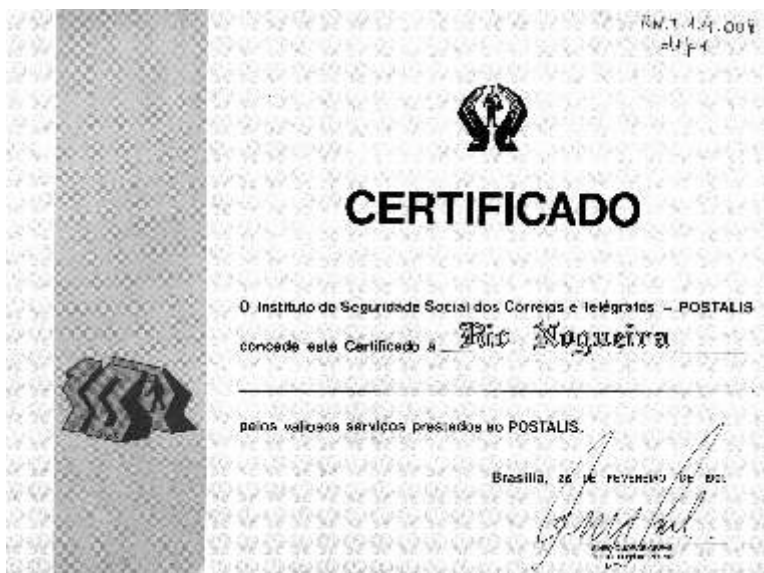
Certificado concedido a RN pelo Instituto de Seguridade Social dos Correios e Telégrafos, como forma de agradecimento por serviços prestados. – Brasília, 1991 (RN.T.1.4.008).