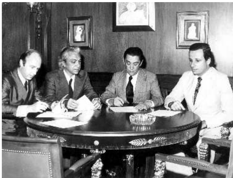
RN em reunião com Juscelino Kubitschek, presidente da República entre 1956 e 1960 (RN.F.0034).