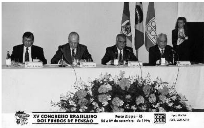
RN no Congresso Brasileiro de Fundos de Pensão, promovido pela Associação Brasileira de Previdência Privada. – Porto Alegre, 1994 (RN.F.0011).