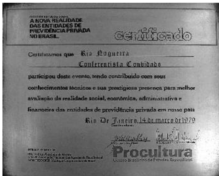
Certificado concedido a RN pelo IBA, ANAFF, MONTECOOPER e Centro Brasileiro de Estudos Específicos por sua participação no Ciclo de Estudos sobre Previdência Privada. – Rio de Janeiro, 1979 (RN.Tr.0011).