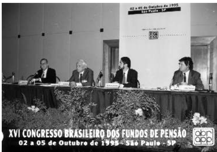
RN do XVI Congresso Brasileiro dos Fundos de Pensão, promovido pela Associação Brasileira de Previdência Privada. São Paulo, outubro de 1995 (RN.F.0011).