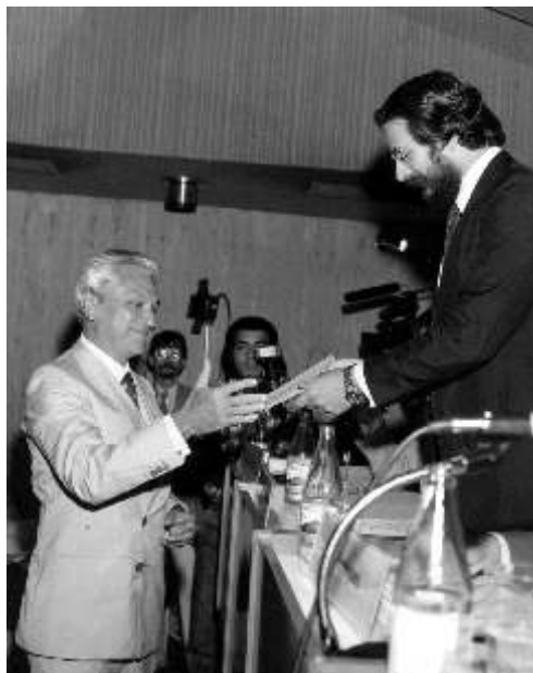
Solenidade de entrega do prêmio "Os Bem Sucedidos", categoria "Serviços Atuariais", a RN, promovido pela revista Bolsa. – Rio de Janeiro, 1983 (RN.F.0015).