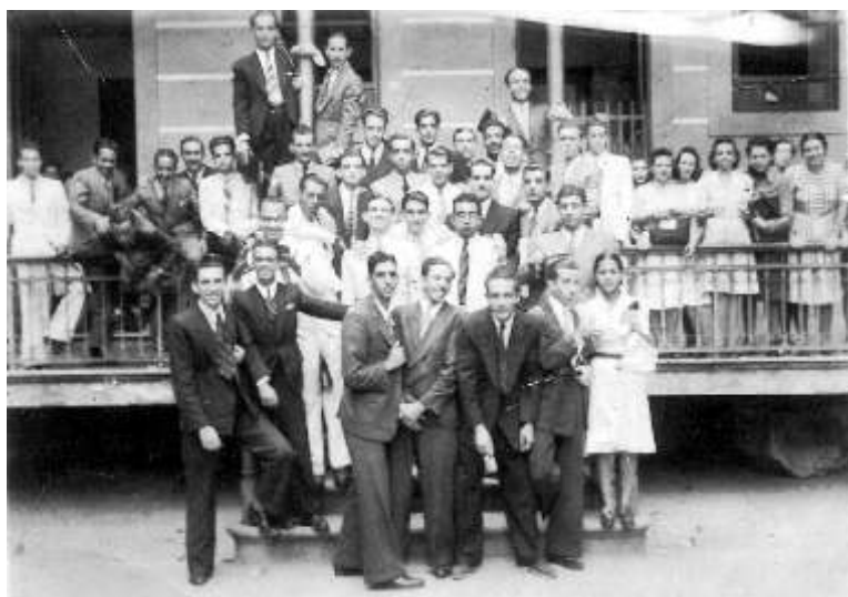
Grupo de estudantes do 2º ano do Curso Complementar de Engenharia do Colégio Pedro II. – Rio de Janeiro, 1940 (RN.R.0001).