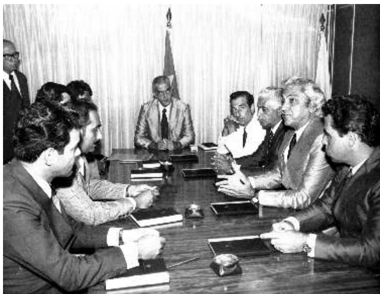
RN em reunião de trabalho sobre previdência. – S.I.,1976 (RN.F.0005).