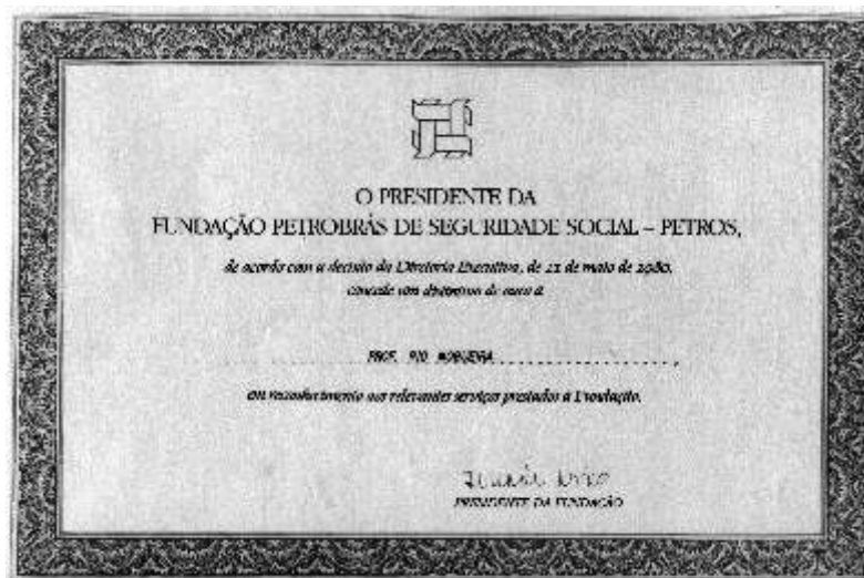
Certificado concedido a RN pela Fundação Petrobrás de Seguridade Social, como homenagem por relevantes serviços prestados à instituição. – Rio de Janeiro, 1980 (RN.T.1.4.007).