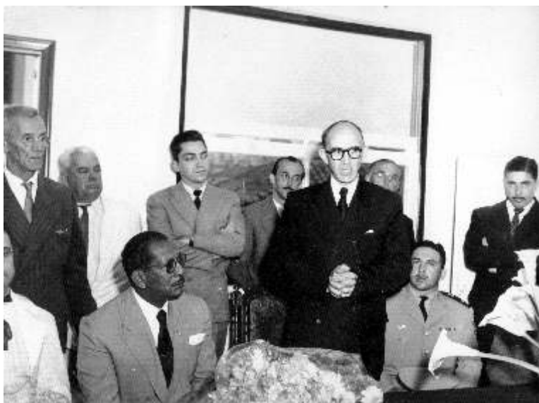
RN em reunião de trabalho com a presença de Gustavo Capanema, provavelmente no período em que foi Ministro da Educação e Saúde (RN.F.0033).