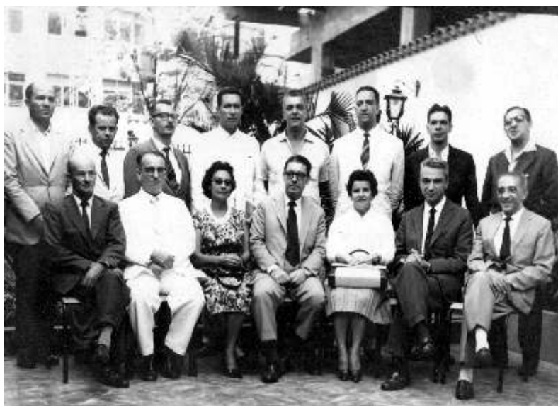
Retrato de RN com grupo não identificado (RN.F.0036).