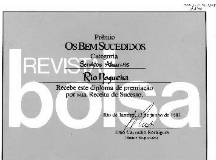
Diploma concedido a RN pela revista Bolsa, por ocasião da entrega do prêmio "Os Bem Sucedidos". – Rio de Janeiro, 1983 (RN.T.1.4.007).